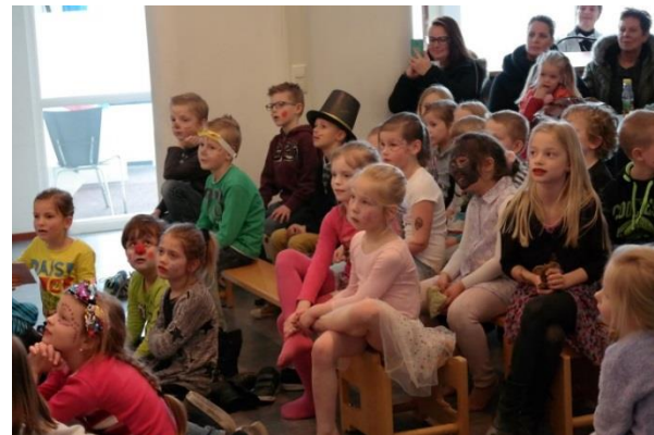
Veel aandacht voor elkaar tijdens de circusvoorstelling groep 3.