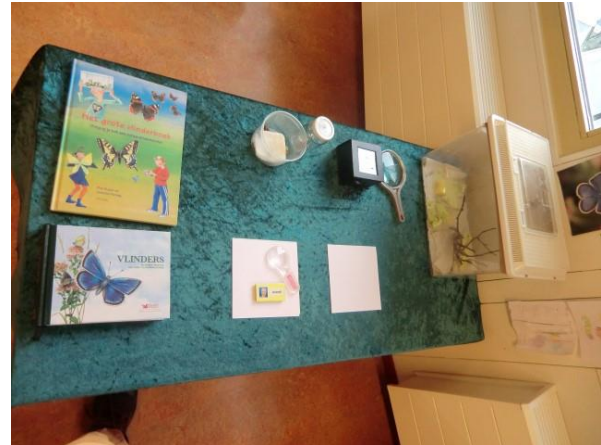
Veel over vlinders ontdekken in groep 1-2.