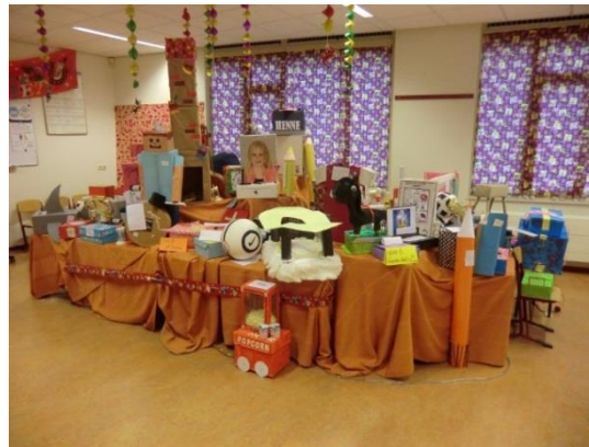
In de bovenbouw wordt werk gemaakt van de surprises.