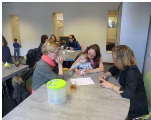
In gesprek over de 4V's tijdens een info-uurtje.

De Kiss and Ride is het laatste actiepoint geweest van het Octopus project.