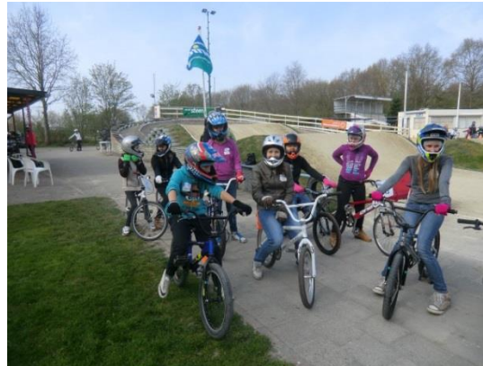
Koningsspelen bij de Boscrossers in Heiloo

Tijdens de vergadering van 17 juni 2015 heeft de leerlingenraad zich gebogen over de z.g. 4V's. Wat kan op De Paperclip V erzwakken, laten V erdwijnen, wat kunnen we V asthouden en/of V ersterken. Naast materiele wensen, zijn leerlingen ook heel goed in staat om hierbij onderwijsinhoudelijke aspecten te benoemen! Ook de uitkomst van dit gesprek is verwerkt in het Schoolplan voor de periode 2015- 2019.