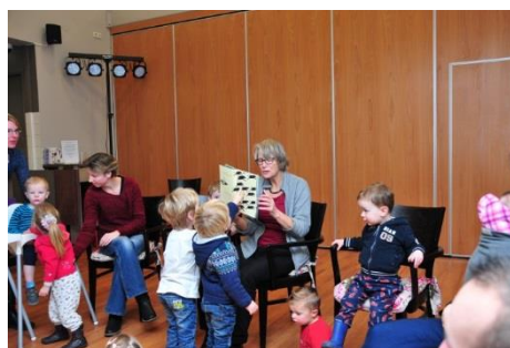
Voorlezen aan broertjes en zusjes in Wijkcentrum De Horst. Voorlezen kan echt overal!