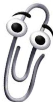
Peuterspeelzaal De Peuterclip