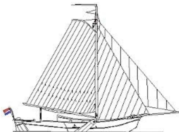
Buitenschoolse opvang De Klipper

STICHTING KINDEROPVANG HEERHUGOWAARD kinderdagverblijf • peuterspeelzaal • gastouderopvang • buitenschoolse opvang