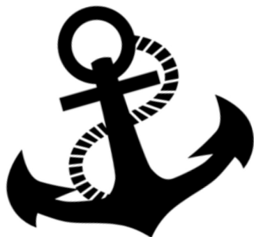
kinderdagverblijf 't Ankertje