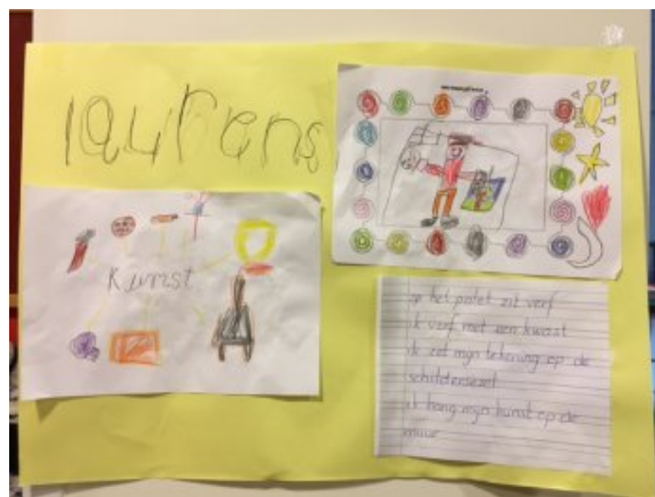
op het palet zit verf ik verf met een kwast ik zet mijn tekening op de schildersezel ik hang mijn kunst op de muur