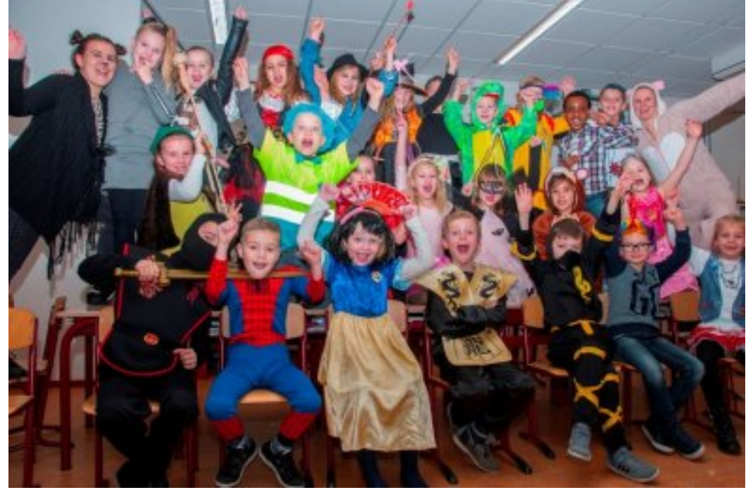
Herkennen jullie iedereen nog?