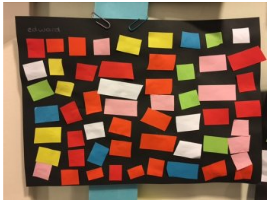
Iedereen kan kunst maken.