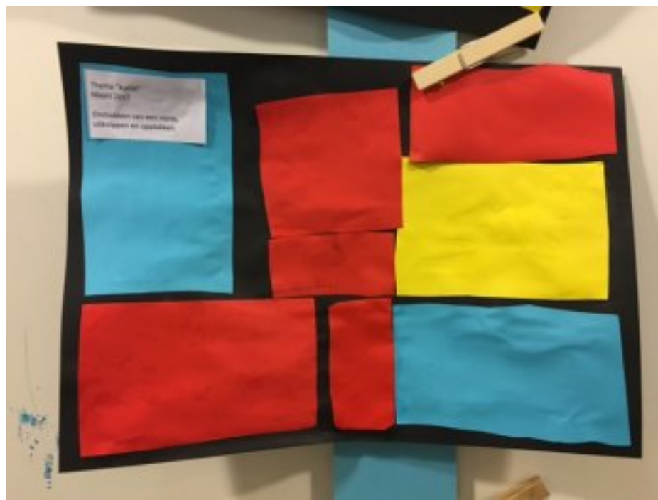
Omtrekken van een vorm, uitknippen en opplakken.