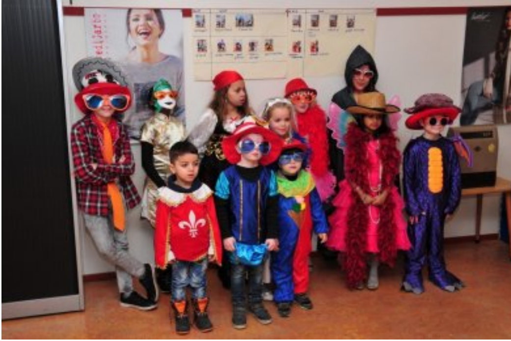
Iedereen droeg de mooiste kostuums.